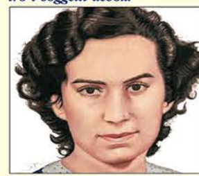
12. Teresa Mattei (1921-2013) Genovese, comunista