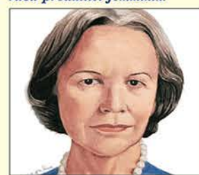
11. Nilde (Leonilde) Iotti (1920-1999) Emiliana, comunista